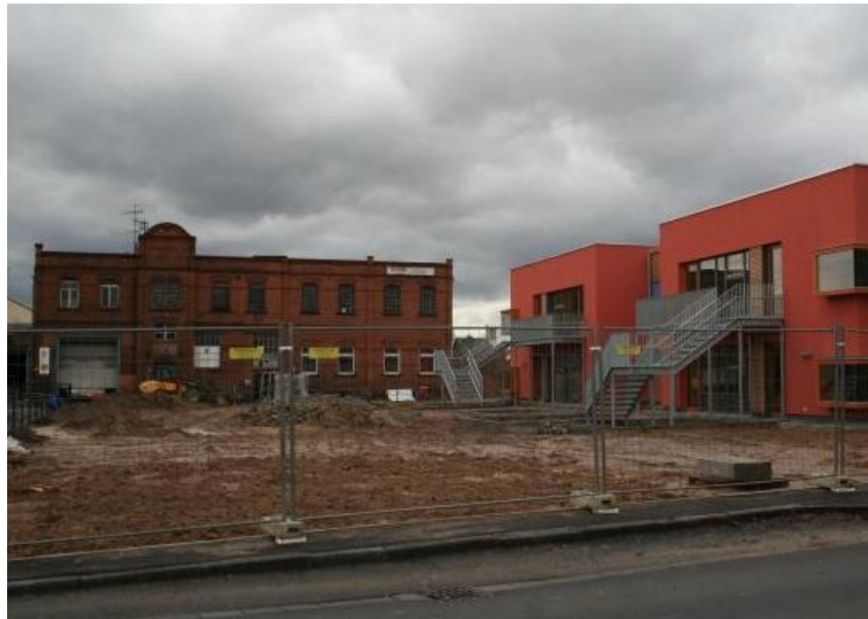
Historisch trifft modern: In die alte Zündholzfabrik (links) kommen Lofts, die Kita öffnet im August.

Auf dem westlichen Areal hat im Dezember die Deutsche Reihenhäuser AG aus Kaiserslautern mit dem Bau von 41 günstigen Reihenhäusern ohne Keller und Balkon begonnen. Es handelt sich um 33 größere Reihenhäuser mit 141 Quadratmetern Fläche und weitere neun