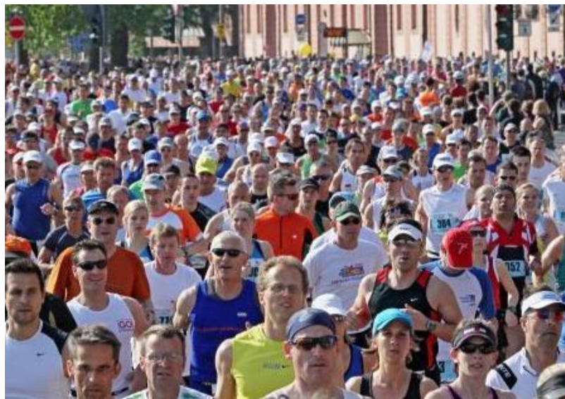
Am 6. Mai laufen die Marathonis wieder zur Hochform auf.

■ Mainz. Sie haben schon etwas Lauf-Erfahrung? Sie laufen regelmäßig, wollen sich weiter verbessern und haben auf der Liste Ihrer guten Vorsätze für 2012 insgeheim den „Gutenberg-Marathon“ notiert? Die Mainzer Rhein-Zeitung bringt Sie gesund an den Start: Die MRZ verlost gemeinsam mit der Krankenkasse DAK, dem größten Mainzer Sportverein TSV Schott, Wolfs Running World und der Sportmedizin der Universität Mainz 20 Startnummern für den Gutenberg-Marathon am Sonntag, 6. Mai.